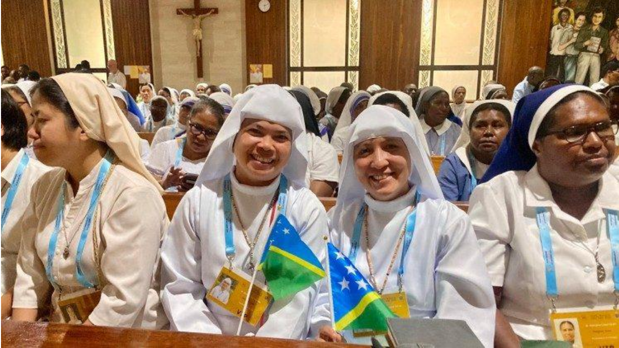
Dòng Đức Mẹ Đức Mẹ Pieta

“Chúng tôi cũng cần được củng cố về mặt tinh thần mà Đức Giáo hoàng hiện đang đem lại cho chúng tôi, thông điệp tinh thần dành cho chúng tôi”, sơ nói thêm.